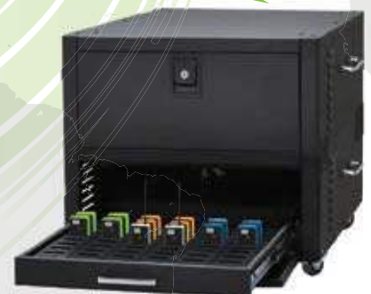
Ladestation mit Schubladen mit 60 Ladefächern, stapelbar