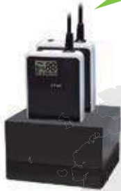
Tischladegerät mit 2 Ladefächern